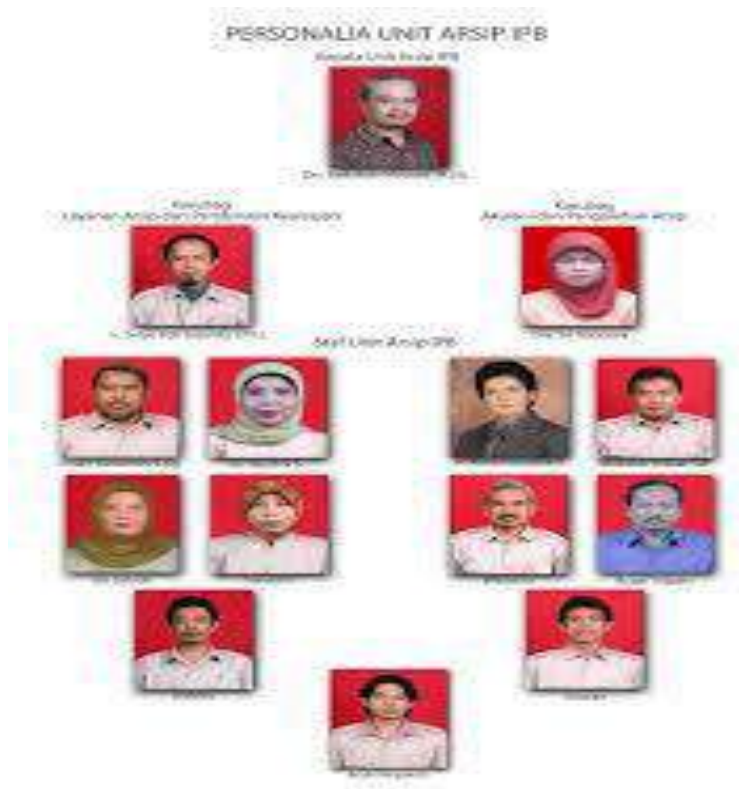
Gambar 4.3. Personalia Unit Arsip IPB