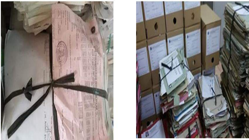
Gambar 4.6 Pengolahan Arsip di Unit Arsip IPB

72